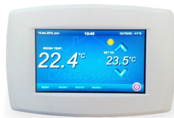
Digitalni sobni korektor touch