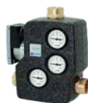
ESBE LTC 261 i CAS (dodatna oprema)