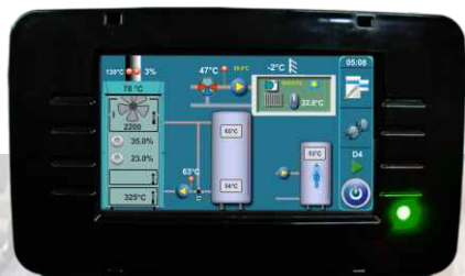
Multifunkcionalna regulacija s ekranom osjetljivim na dodir.